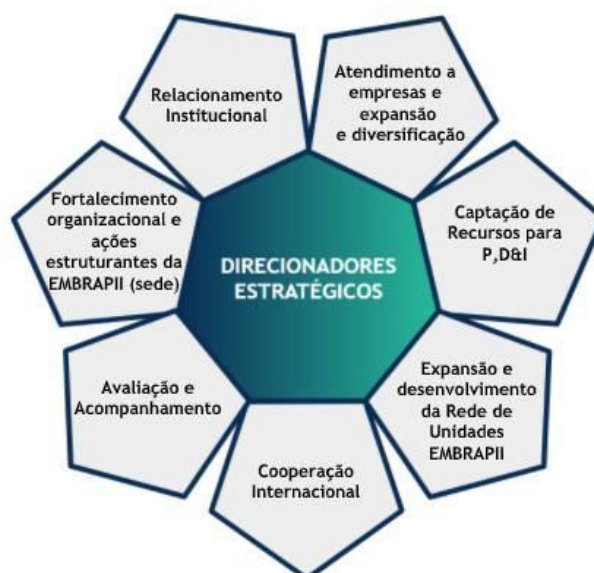
Figura 2 – Quadro de direcionadores estratégicos

Em virtude dos seus resultados, da conjuntura econômica, e da comprovada importância da inovação tecnológica na competitividade do país, a EMBRAPPII considera que tem relevantes desafios e excelentes perspectivas para os seus próximos 10 anos. Os direcionadores estratégicos são detalhados a seguir.