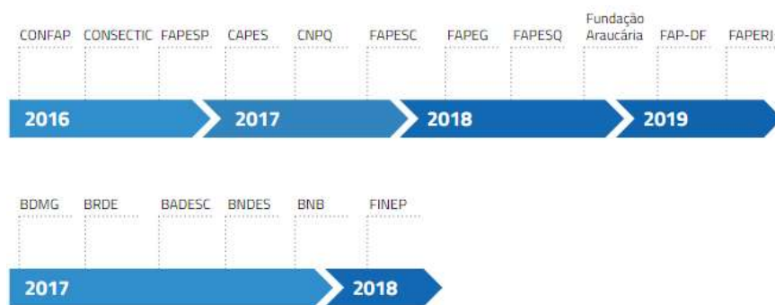
Figura 4 – Cronologia dos acordos com FAPs e bancos regionais

Para o próximo ciclo contratual, a EMBRAPPII planeja aprimorar e ampliar as parcerias existentes, incluindo as FAPs dos estados que possuem Unidades EMBRAPPII. Outros modelos de parcerias com os estados serão propostos visando reforçar o potencial de pesquisa aplicada de ICTs estaduais que, acolhidas na rede de Unidades EMBRAPPII, possibilitem ampliar o conjunto de ecossistemas de inovação no nível estadual.