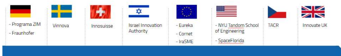
Figura 5 – Parcerias Internacionais

No próximo ciclo contratual, a EMBRAPPII continuará a ampliar as oportunidades de cooperação internacional visando atender à crescente demanda internacional e brasileira para explorar as diversas possibilidades oferecidas no manejo das vantagens competitivas e comparativas disponíveis.