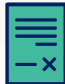
Negociações com a empresa